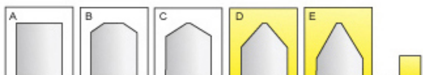
平的（無倒角） 標準型 120°尖型 90°尖型 60°尖型 特別角度